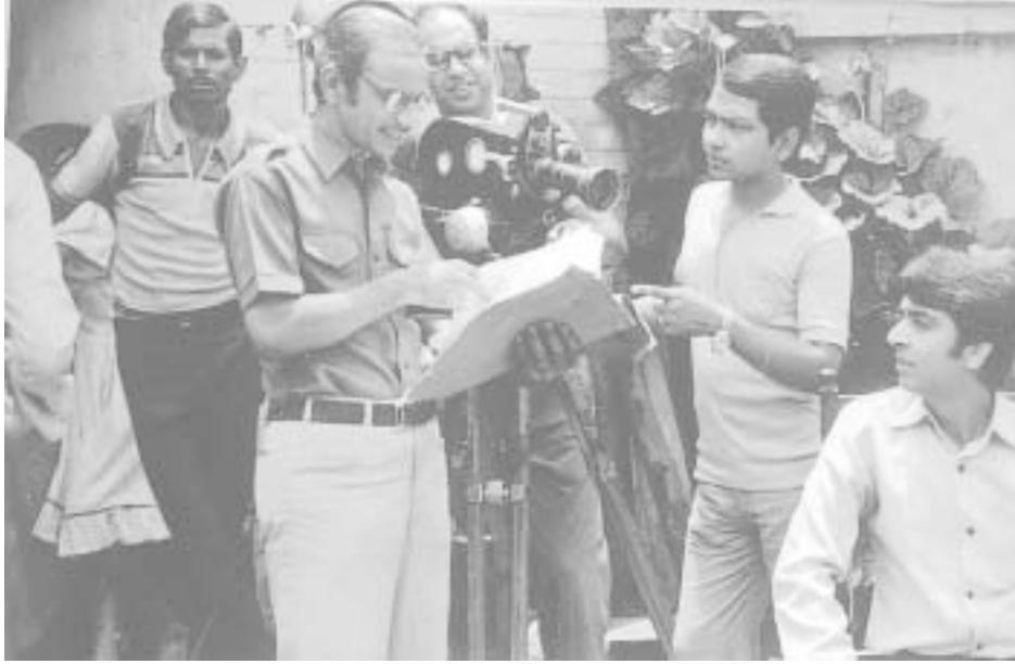
टेलीफ़िल्म की शूटिंग में