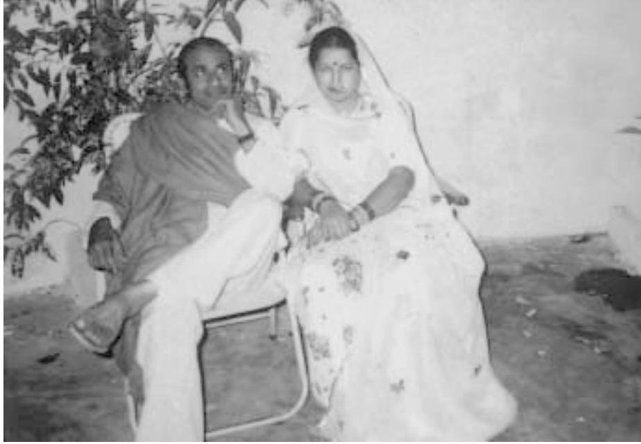
जीवनसंगिनी के साथ