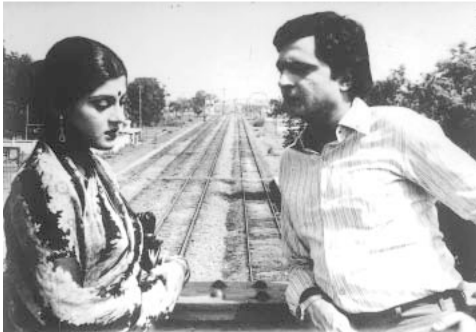
टेलीफ़िल्म 'सूली ऊपर सेज पिया की' का एक दृश्य